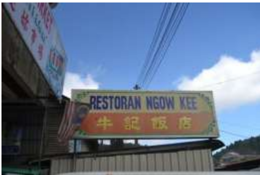
牛记饭店外观招牌

民以食为天，来到甘榜拉惹也一定要试试当地的美食。据村长表示，牛记饭店的煮炒相当驰名。据了解，这里每天下午四点半，就会有手工包子售卖，届时就会看到络绎不绝的人潮排队等候。在七种口味的包子中，最热门的是叉烧包。除了这些餐馆以外，还有来发海鲜店、姐妹海鲜小食，鸿运餐室，章泉小炒等。