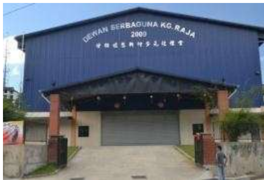
甘榜拉惹新村多元化礼堂外观

每逢新年过节时分，多元化礼堂（Dewan Serbaguna Kg. Raja）和大草场就成为了当地居民同欢共乐的聚集地。村长说：“每逢的新春大团拜、中秋晚会，或者是青年篮球比赛等活动，才会在这里举行。”，可见其重要的象征性。这所多元化礼堂耗资 160 万零吉，历时一年多的修建工程，于 2009 年竣工完成，自此成为了当地居民活动的主要场地。