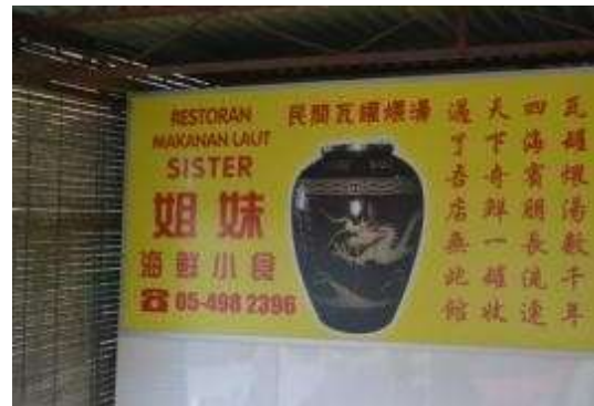
姐妹海鲜小食外观