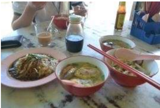
早餐-干捞粿条配搭炸料