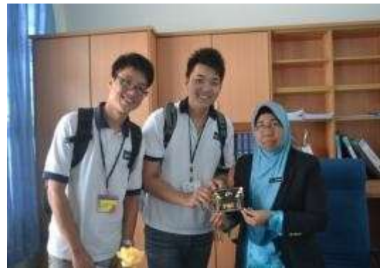
我们与校长的合照