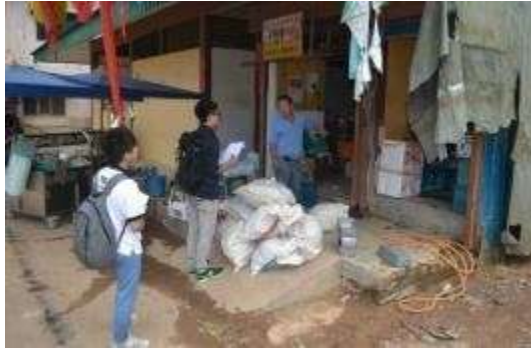
当地商家反映民生问题

遇到了阻碍。二为农作物化肥渗入土壤与河流，造成水源污染，导致视水如金的当地人民面对用水和灌溉问题。三为在河流附近建设的临时房屋与厕所的使用，造成排泄物等直接排入河流，造成水源污染问题更加严重。