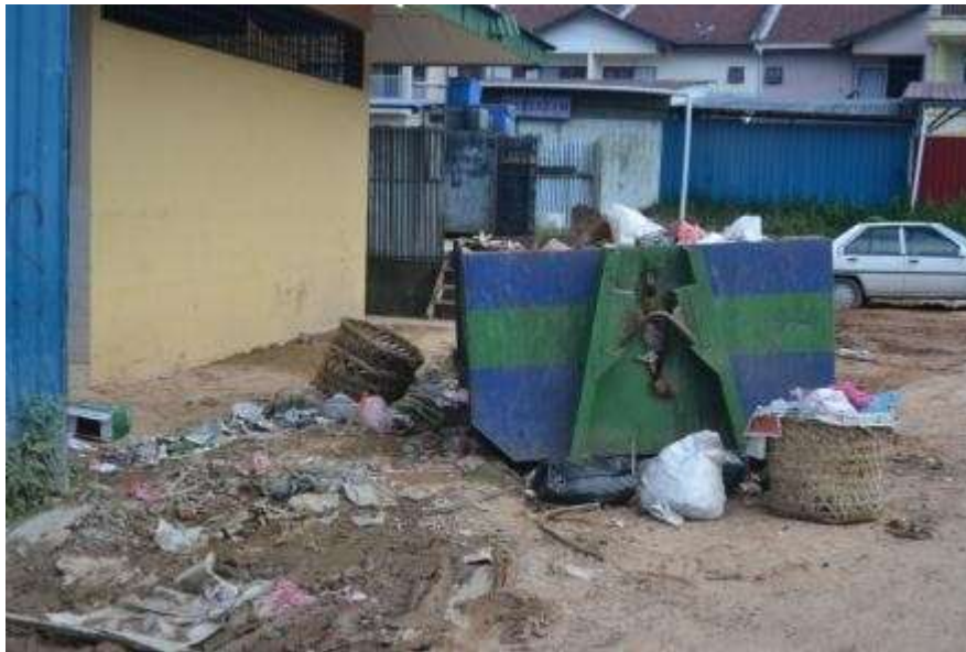
无人清理的垃圾箱

在我们与当地居民的采访过程中，发现甘榜拉惹的商业区存在着垃圾清理问题。根据居民表示，由于垃圾的清理效率不理想，因而导致垃圾发出恶臭，影响当地人民的健康，进而影响游客的到访兴致。此外，居民把农业肥料丢弃山里与路旁的问题，也需要民众与政府的合作，才能维护甘榜拉惹的健康环境。