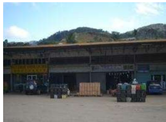
批发市场外一罗罗的蔬果等待运送