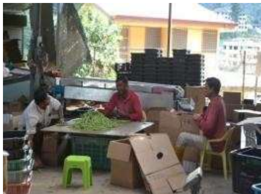
外籍员工们正在处理长豆

由于种植业的发达，连而连锁带动农作物的批发市场生意。从一系列的农作物收割、分类、包装、运输等等，批发商皆一手操办，为农业种植者提供了销售的管道与农作物后续工作上的便利。由于批发市场的蓬勃，进而促进当地的经济发展，提供了许多就业机会。据村长透露，甘榜拉惹的就业机会分成两种，华人多属于管理阶层，劳动阶级多是孟加拉和尼泊尔等外籍劳工担任。因此，身处甘榜拉惹的我们，不仅随处可见大型的批发市场，也看到许多外籍员工在里头埋头苦干。