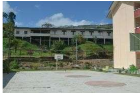
教师宿舍（高处白色建筑物）