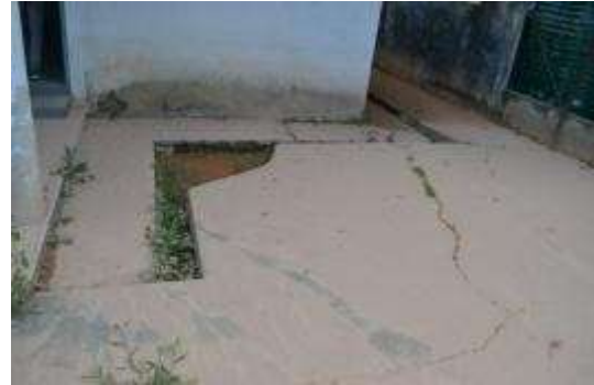
水灾后遗留的泥浆